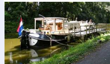
Nieuw schip: paviljoentjalk Catharina Elisabeth