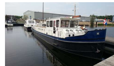
Nieuw schip: katwijker Onderneming V