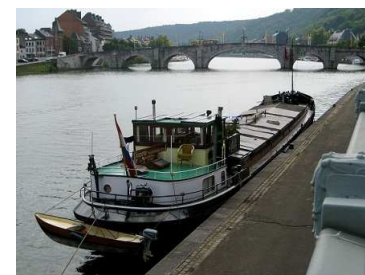
Nieuw schip: luxe motorschip Jeanette

Steunt u ons initiatief en wilt u donateur worden? Maak dan 30 euro over op bankrekeningnummer 10.67.53.444 t.n.v. Stichting Er-varen Arnhem, o.v.v. 'donateur' en stuur een mail met uw adresgegevens en eventueel scheepsnaam naar flessenpost@schepencarrousel.nl