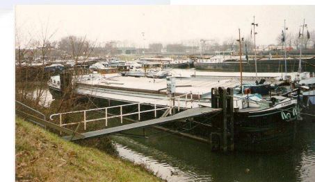
Nieuw schip: de spits Flamingo