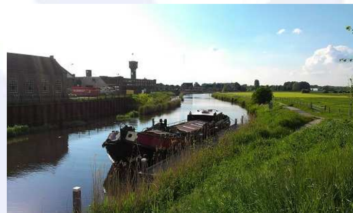
Nieuwe locatie: Ulft (Gelderland)