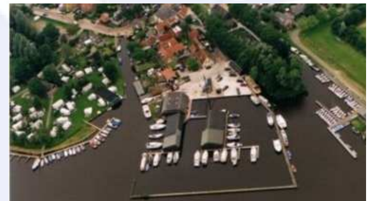
Nieuwe locatie: Terhorne