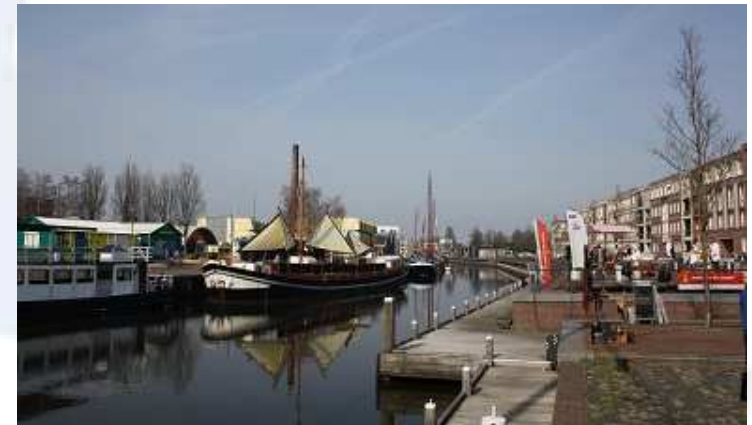
Nieuwe locatie: Amersfoort

De Schepencarrousel is een systeem waarbinnen schepen uitgewisseld kunnen worden tussen ligplaatsen. De schepen liggen voor een korte periode (ca. 3 maanden) op een ligplaats. Op de ligplaats presenteren de schepen het verhaal van het schip en de cultuurhistorie van de scheepvaart. Van het schip wordt verteld waar en waarom het gebouwd is, wat het zoal heeft beleefd in de loop van de tijd en waarom bepaalde aanpassingen gedaan zijn. Voor meer informatie verwijzen wij u naar onze website www.schepencarrousel.nl