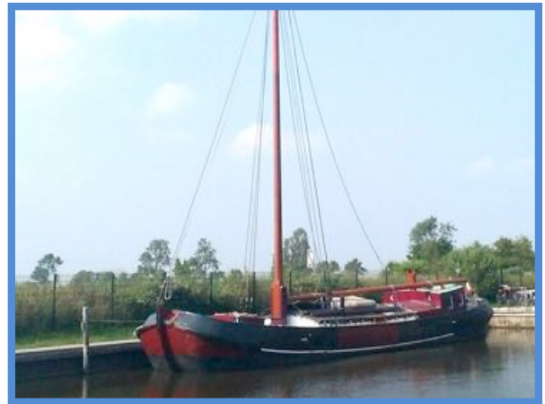
Gerestaureerde Vrouw Jacoba nu