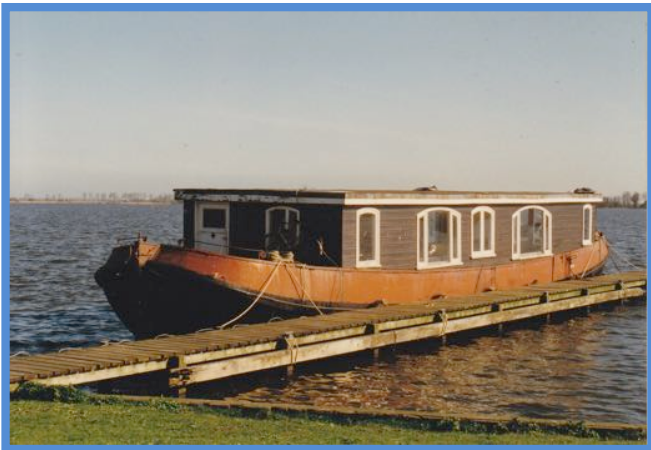
Vrouw Jacoba als woonark in 1997

Motor: DAF 575 Vermogen: 100 pk Bouwjaar motor: 1970 Eigenaar: Hinco Veenstra Contact: (06) 3098 8960